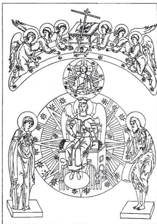
Новгородская икона Софии Премудрости Божией